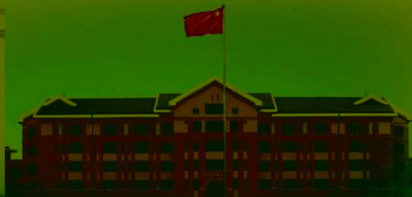
天津机电职业技术学院

TIANJIN VOCATIONAL COLLEGE OF MECHANICAL AND ELECTRICAL ENGINEERING