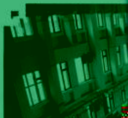
DMC 数控技术 训练场所